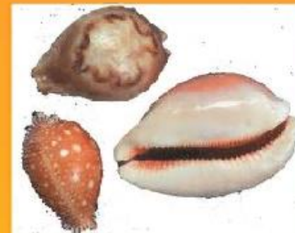
Раковины Каури (Приморье)