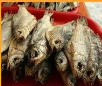
Сушёная рыба (Исландия)