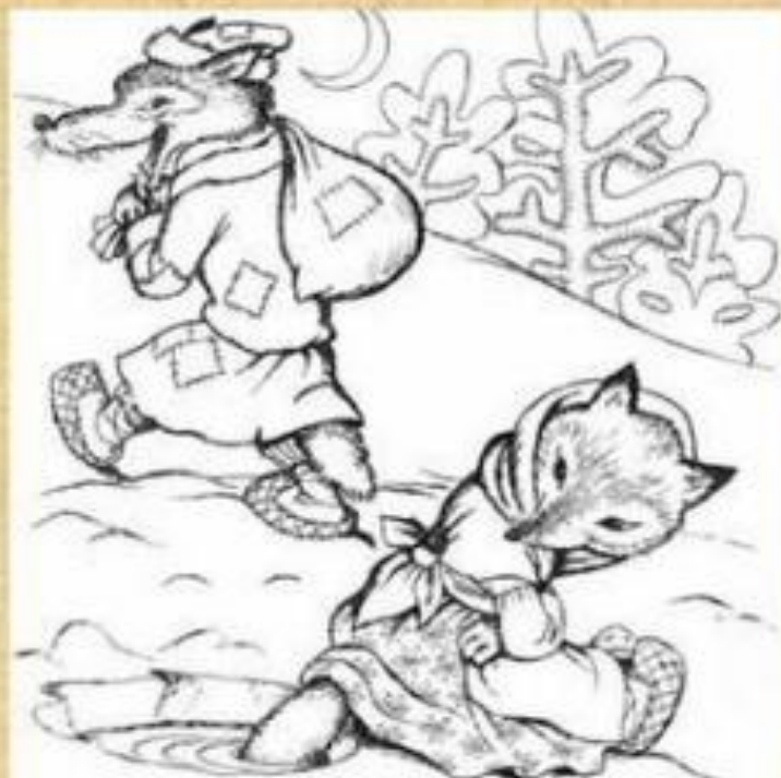
ЛИСА И ВОЛК