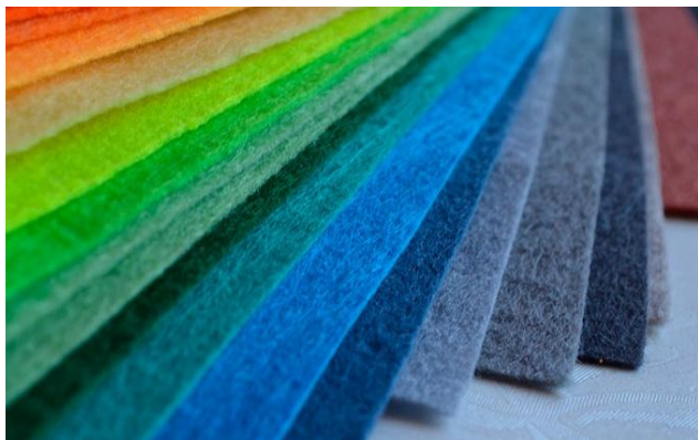
Так выглядит листовой фетр

Фетр является универсальным материалом, очень прост в использовании, он плотный, отлично держит форму и имеет различные расцветки, причем, одинаковых оттенков с обеих сторон, его не обязательно сшивать, можно клеить и создавать различные игрушки и развивающие пособия. Люди, которые занимаются рукоделием, по достоинству его оценили. Фетр не мнется и не портится, так что при создании картины не нужно временить, решая, какой материал выбрать.